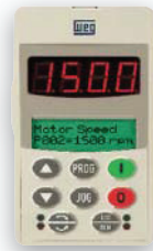
HMI CFW09 LCD