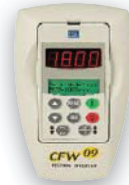
HMI CFW09 LCD N4